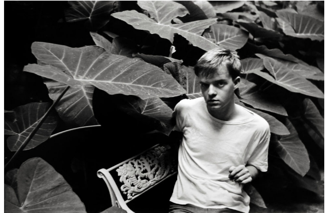
Truman Capote par Henri Cartier-Bresson, 1947

- choisir un lieu spacieux pour donner de l'air à votre image et permettre l'incrustation d'images ou de textes sur la vidéo si besoin. Ici l'essentiel est que votre buste se détache clairement de l'arrière-plan. Evitez donc les espaces surchargés et privilégiez des murs nus ou peu encombrés, un paysage ou un arrière-plan végétal.