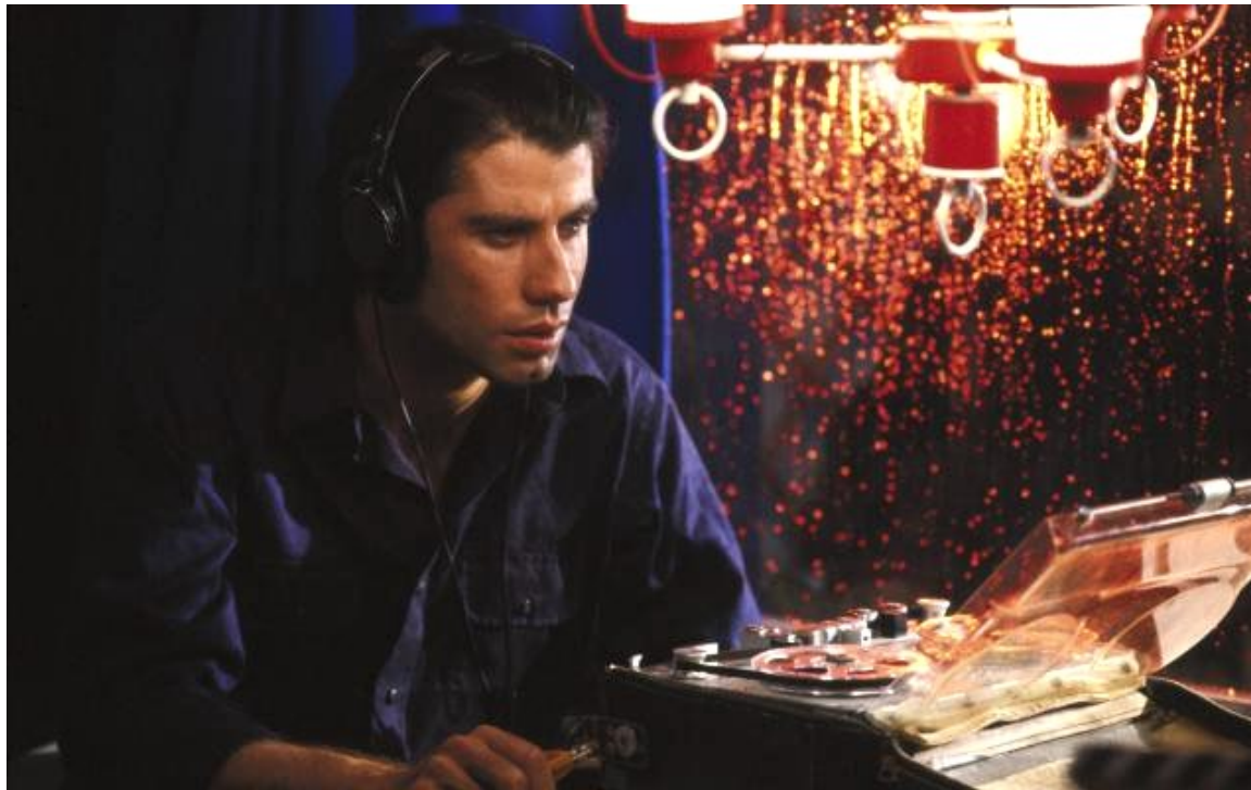
Blow out , Brian de Palma, 1981

- le son : dans une vidéo, le son est trop souvent négligé. Pour que votre enregistrement vidéo gagne en qualité, pensez à :