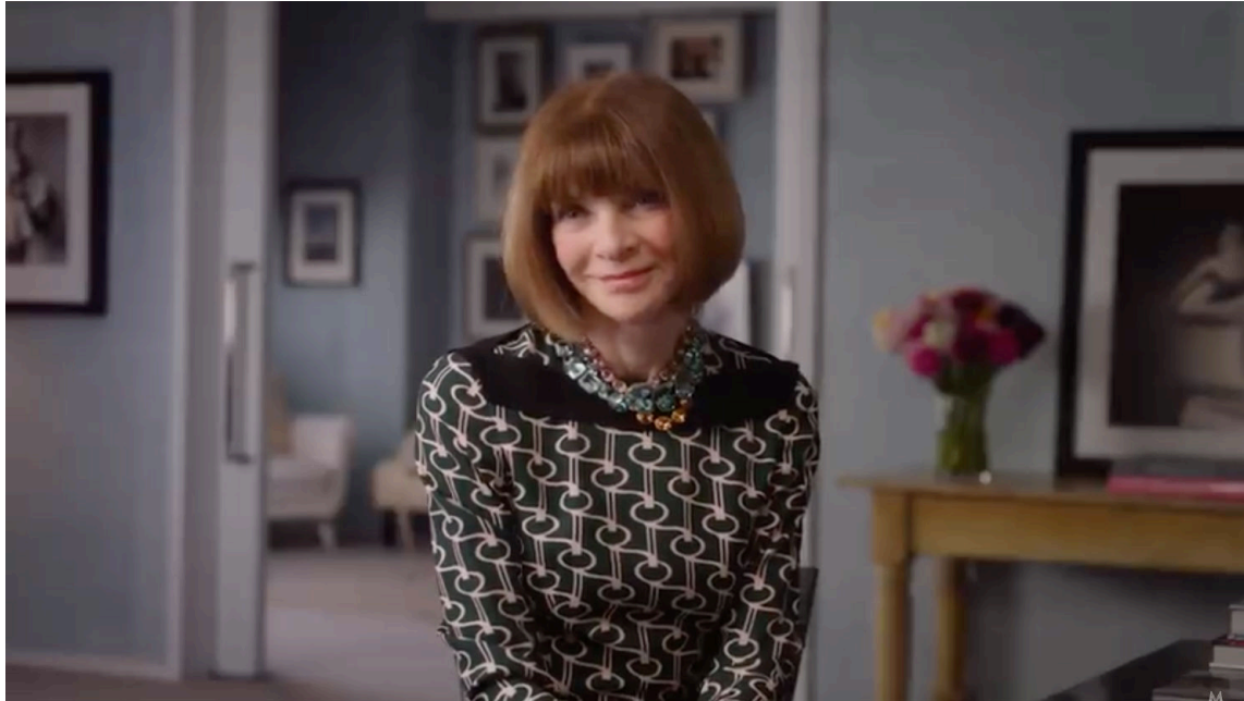
Anna Wintour Teaches Creativity and Leadership, 2019

- choisir votre emplacement dans le champ : si vous êtes assis pour parler, choisissez un siège léger (par exemple un tabouret) et placez-vous à une distance d'un mètre cinquante minimum de la caméra . Installez-vous face à la caméra (pas forcément au centre exact de l'image) et veillez à conserver de l'espace autour de vous pour donner de l'air à votre image et éventuellement pouvoir incruster des images ou textes sur la vidéo.