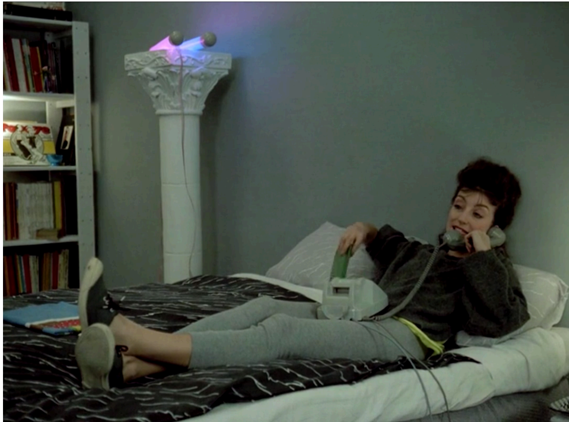
Les nuits de la pleine lune , Eric Rohmer, 1984

- l'auto-portrait détourné : parler de team building en filmant les plantes de votre jardin, développer l'art du retail avec ses chats ou prodiguer des conseils sur la gestion de crise en suivant l'élaboration d'une poterie, toutes les options restent possible pour incarner autrement votre discours.