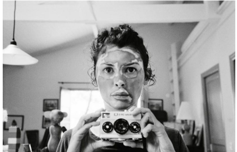
Autoportrait, Audrey Tautou

- votre vision : certains ont besoin de plus de mots que d'autres pour se faire comprendre. D'autres ont besoin de textes, d'images, de sons, de dessins. Dans ce sens, préparez à l'avance dans un document tous les éléments que vous souhaitez inclure dans la vidéo. Notez tout de même qu'ici encore, la clarté et la lisibilité doivent primer et rappelez-vous : « une image vaut mille mots. »