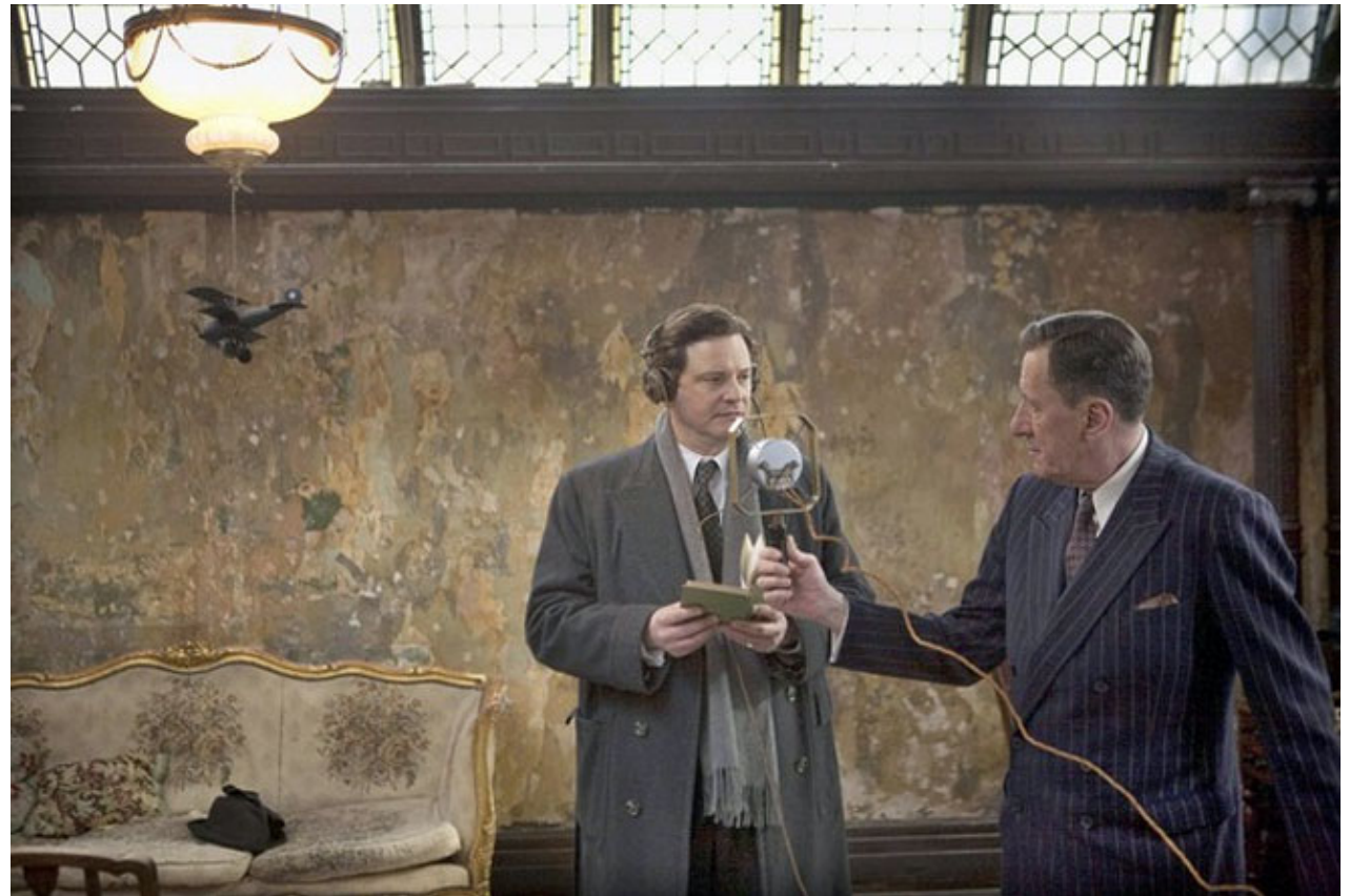
Le discours d'un roi, Tom Hooper, 2010