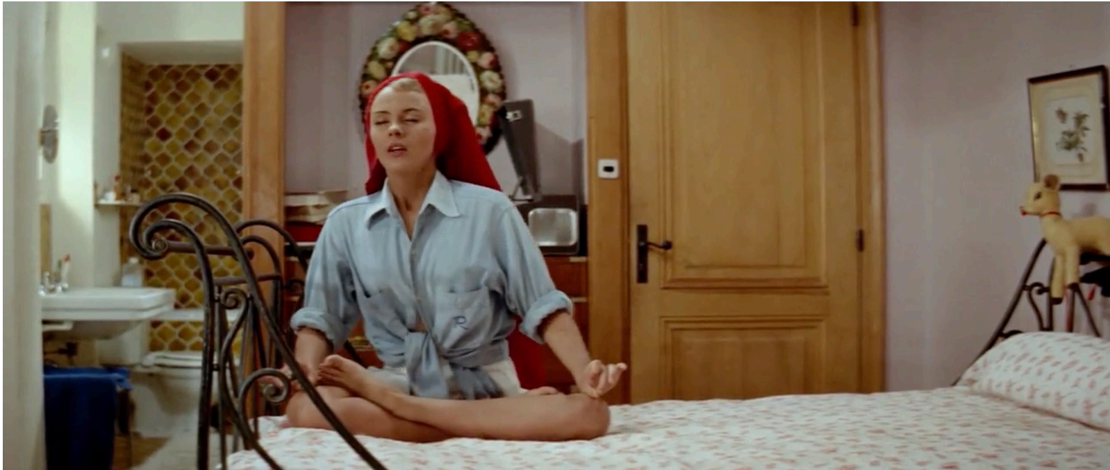
Bonjour tristesse , Otto Preminger, 1958