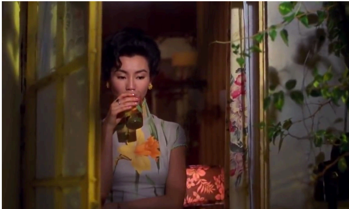
In the mood for love, Wong Kar-wai, 2000

- filmer dans un décor clairement identifiable : si vous faites le choix de tourner votre vidéo dans un lieu particulier (une chambre, un salon, un jardin), non un lieu neutre (devant un mur), pensez à rendre cet espace lisible en jouant sur les couleurs, les motifs et les accessoires.