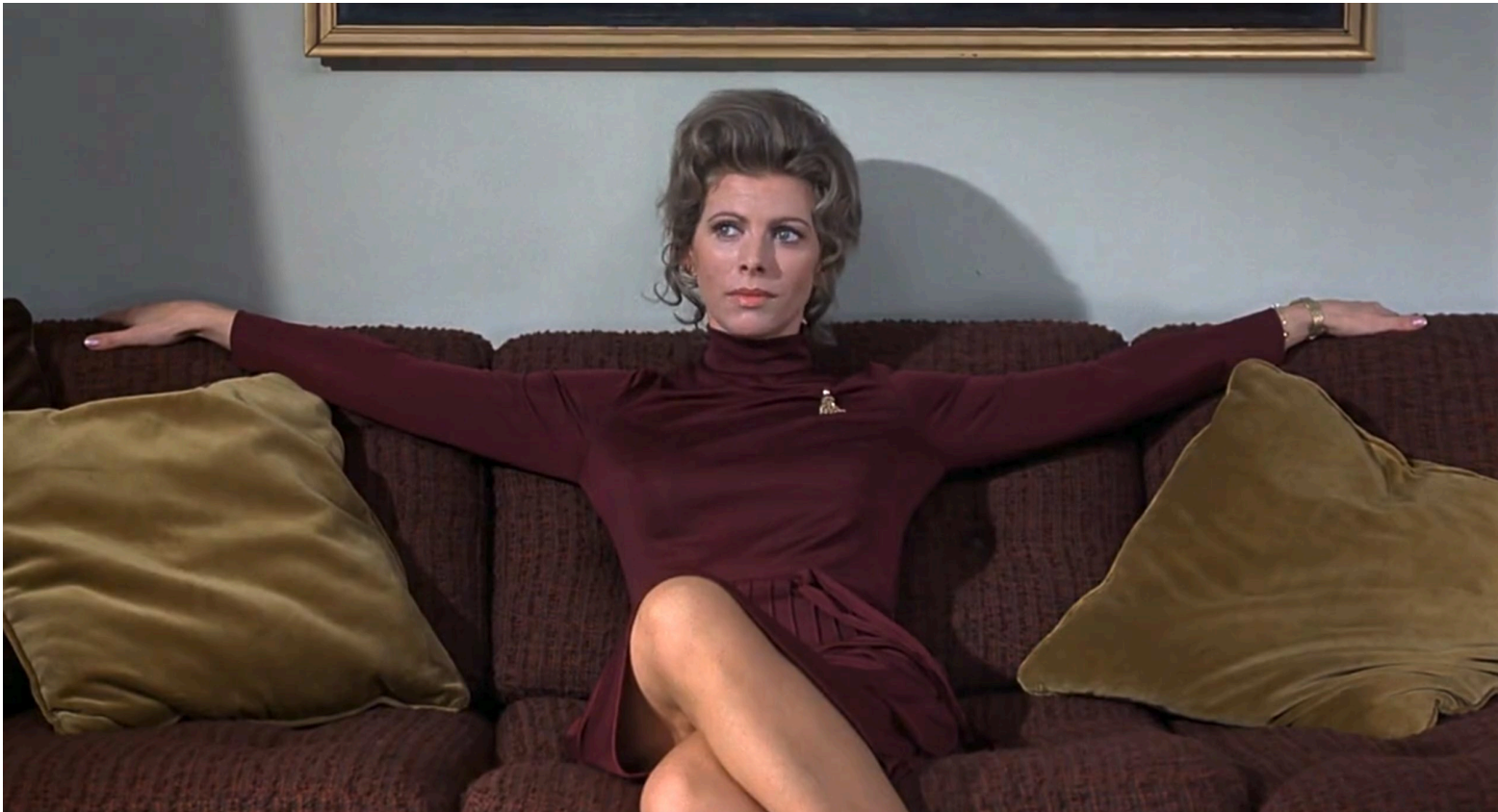
Frenzy , Alfred Hitchcock, 1972

Ce court document réunit quelques conseils pour réaliser soi-même ses enregistrements vidéo. Ces principes de base du tournage vous permettront d'éviter quelques erreurs communes puis d'éditer vos vidéos dans de bonnes conditions