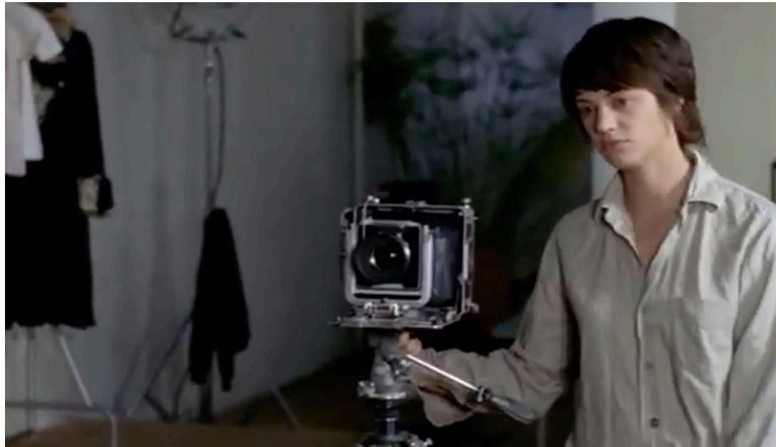
Tiresia , Bertrand Bonello, 2003